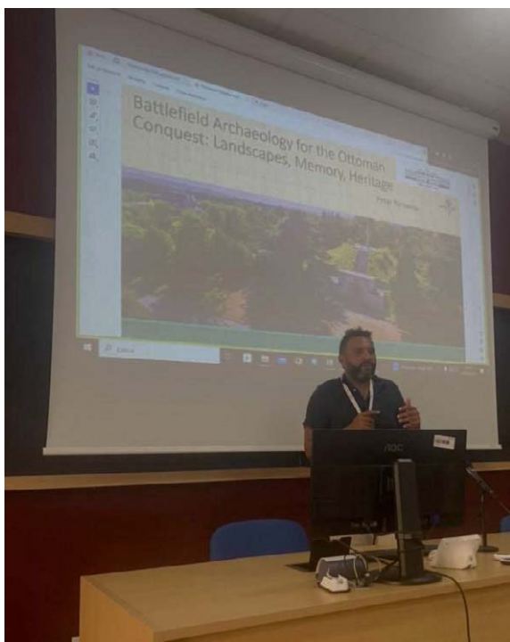
Обр. 3. Представяне на културното наследство, свързано с османското завоевание на Балканите