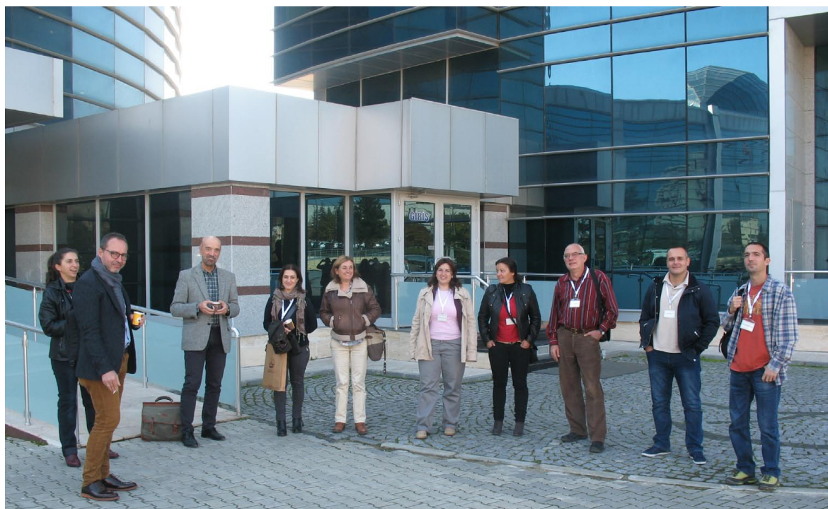
Обр. 2. Част от участниците в конференцията пред сградата на провеждането ù Fig. 2. Part of the participants outside the building where the conference took place

ресни неолитни явления и структури, така и с изключително атрактивни и стойностни артефакти (особено керамика и пластика). Ще маркирам докладите и темите им по реда на представянето им: